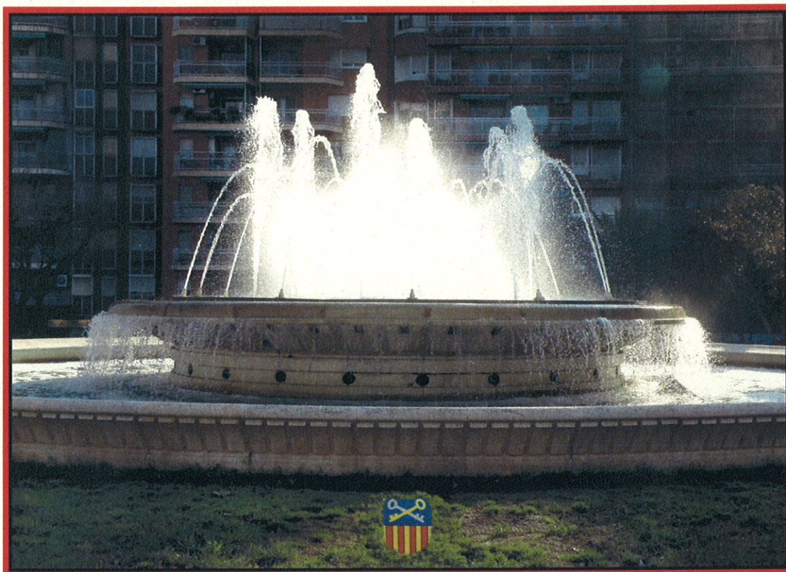
Font ornamental de la plaça de Catalunya