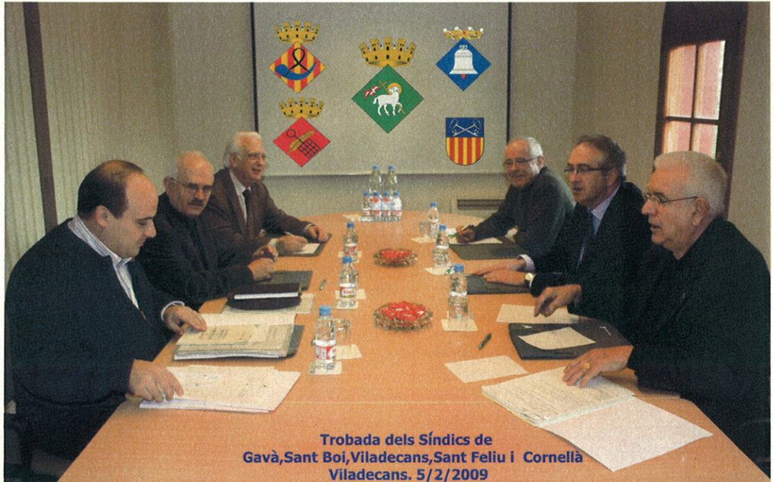
Trobada dels Síndics de Gavà, Sant Boi, Viladecans, Sant Feliu i Cornellà Viladecans. 5/2/2009