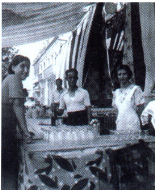
Figura 1: Envelat d'una de les associacions històriques de Gavà.

La primera entitat de Gavà va néixer l'any 1862 i s'anomenava Montepío de San Nicasio . Aleshores la gent s'autoorganitzava per cobrir la inseguretats davant malalties i accidents laborals. El principal espai de la vida associativa i cultural de les classes populars de Gavà a finals de segle XIX i els primers trenta anys del segle XX va ser el Cafè del Centre (avui Casal del Centre). A partir d'aquests dos exemples històrics, les associacions o entitats es van desenvolupar segons les forces ideològiques i polítiques ( Centre Català de Gavà, Centre Federalista de Gavà, Amics de les Nacions Unides, La Mata de Jonc... ), culturals i socials ( Roselles de Gavà, l'Esbart Folklore de Gavà, Agrupació fotogràfica Gavà, Associació de Veïns d'Eramprunyà... ) i, més recentment, les de caire ambiental, les quals es descriuen més endavant.