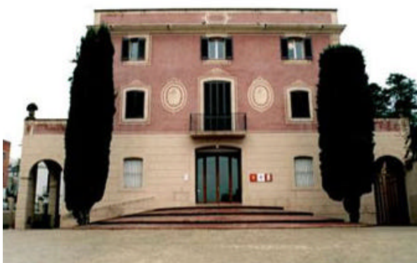
Figura 9: Museu de Gavà

L'equipament de Gavà més important que acull a la població interessada en aspectes de divulgació ambiental és el Museu de Gavà, que té els següents espais: