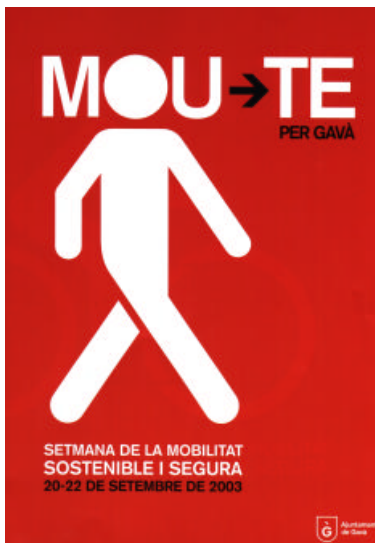
Figura 5: Fulletó informatiu de la campanya “Mou-te per Gavà”.