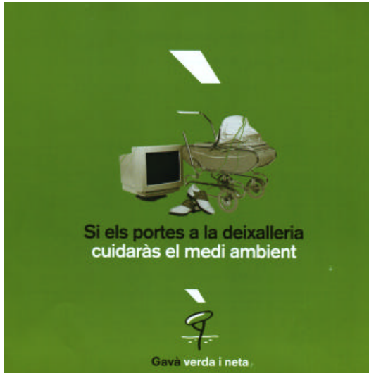
Figura 4: Fulletó de la campanya “Si el portes a la deixalleria, cuidaràs el medi ambient”