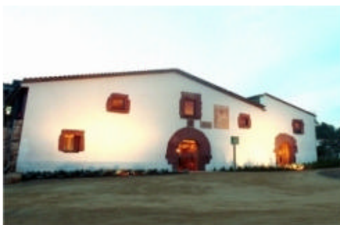
Figura 7: Mas de Can Llong.

L'àrea que envolta Can Llong, un mas construït al segle XV, està obert actualment a tots els visitants que vulguin passejar per un àmbit natural que disposa d'una zona de picnic amb taules i barbacoes. Es pot gaudir del paratge i la jardineria que envolten el mas, amb boscos de pins i espècies mediterrànies, com els garrofers i les oliveres, testimonis dels antics conreus. També es poden realitzar itineraris de natura que on es descobreixen els turons, les rieres, les fonts, les masies de la vall de la Sentiu, o les vistes panoràmiques de la roca de Migdia.