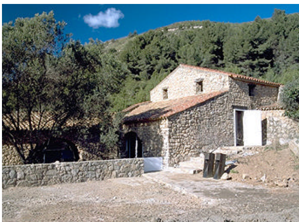
Figura 8: Centre de Recursos Can Joan.